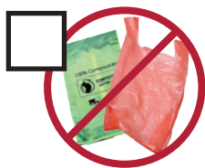
Plastic Bags bolsas de plástico