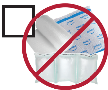
Plastic Packaging envases de plástico