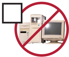
E-Waste residuos electrónicos