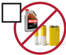
Hazardous Waste desechos peligrosos