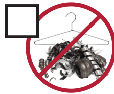
Scrap Metal chatarra