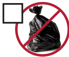
Garbage Bags bolsas de basura